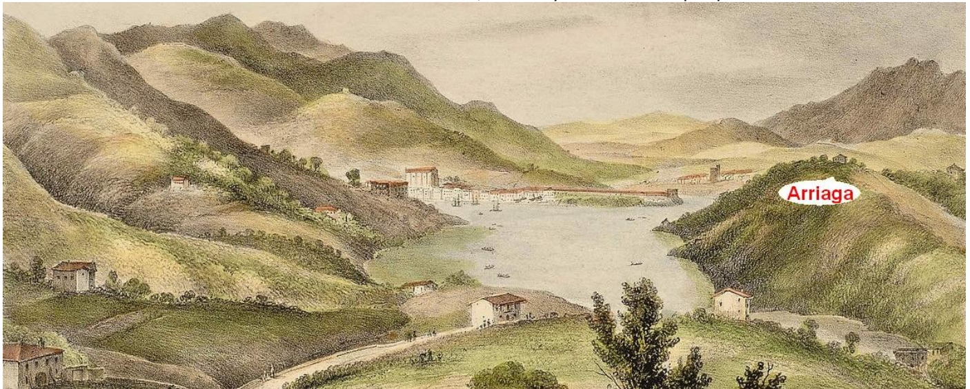
"Pasaiako portuaren barnealdea", xehetasuna. G. Carpenter-en grabatua, 1840. urte aldean. Zumalakarregi Museoa "Interior del puerto de Pasages", detalle. Grabado de G. Carpenter, hacia 1840. Zumalakarregi Museoa.

Donostiako Udalaren ondarea babesteko Plan Berezian (HOEBPE) bakarrik armarria eta farolak daude babestuak, F mailarekin.