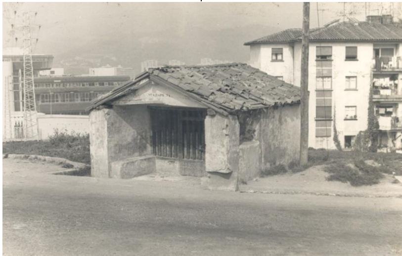
Santa Barbara ermita, 1967 (San Pablo Parrokia, arg.: Félix Iranzo)