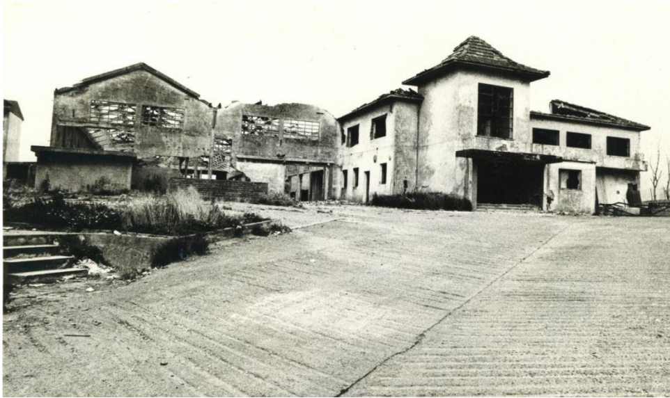
Toschi-Ibérica fabrikaren hondakinak, 1985 (Mertxe Fernández, arg.: Apraiz)